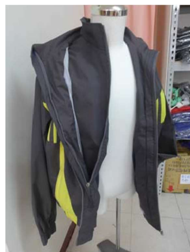
可拆卸式外套背心