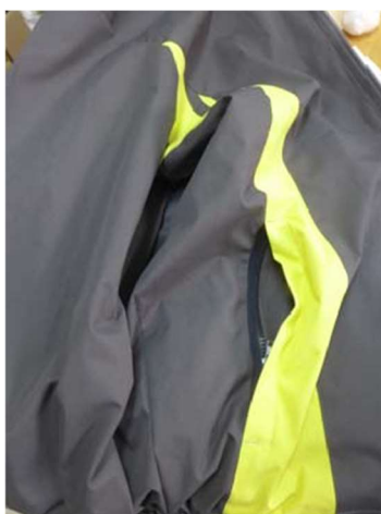
冬運動外套正面側口袋