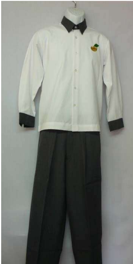
男生冬上衣與長褲