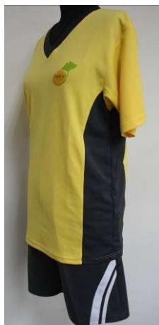
夏運動服全套側面