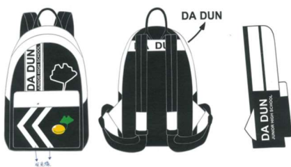
後背式書包（詳規格說明）