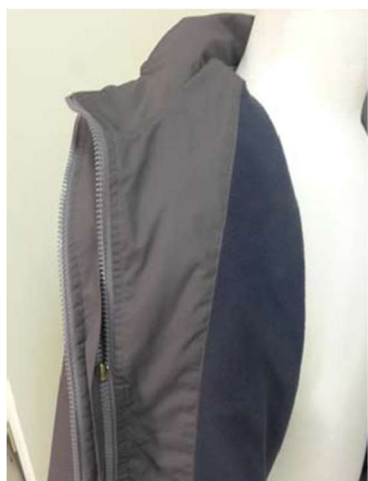
可拆卸式外套背心