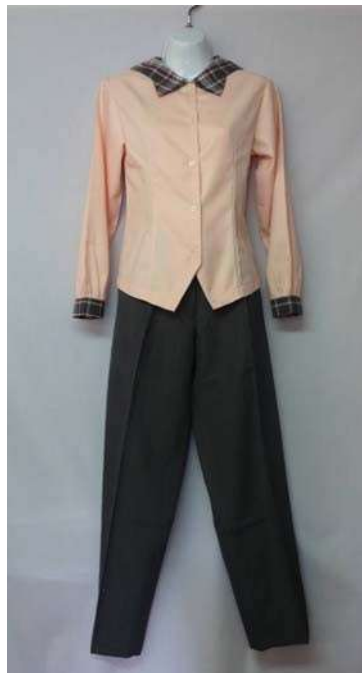
女生冬上衣與長褲