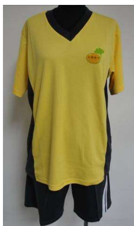
夏運動服全套正面